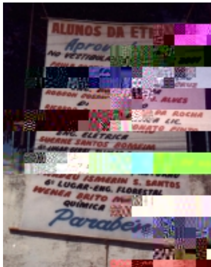
ALUNOS APROVADOS NO